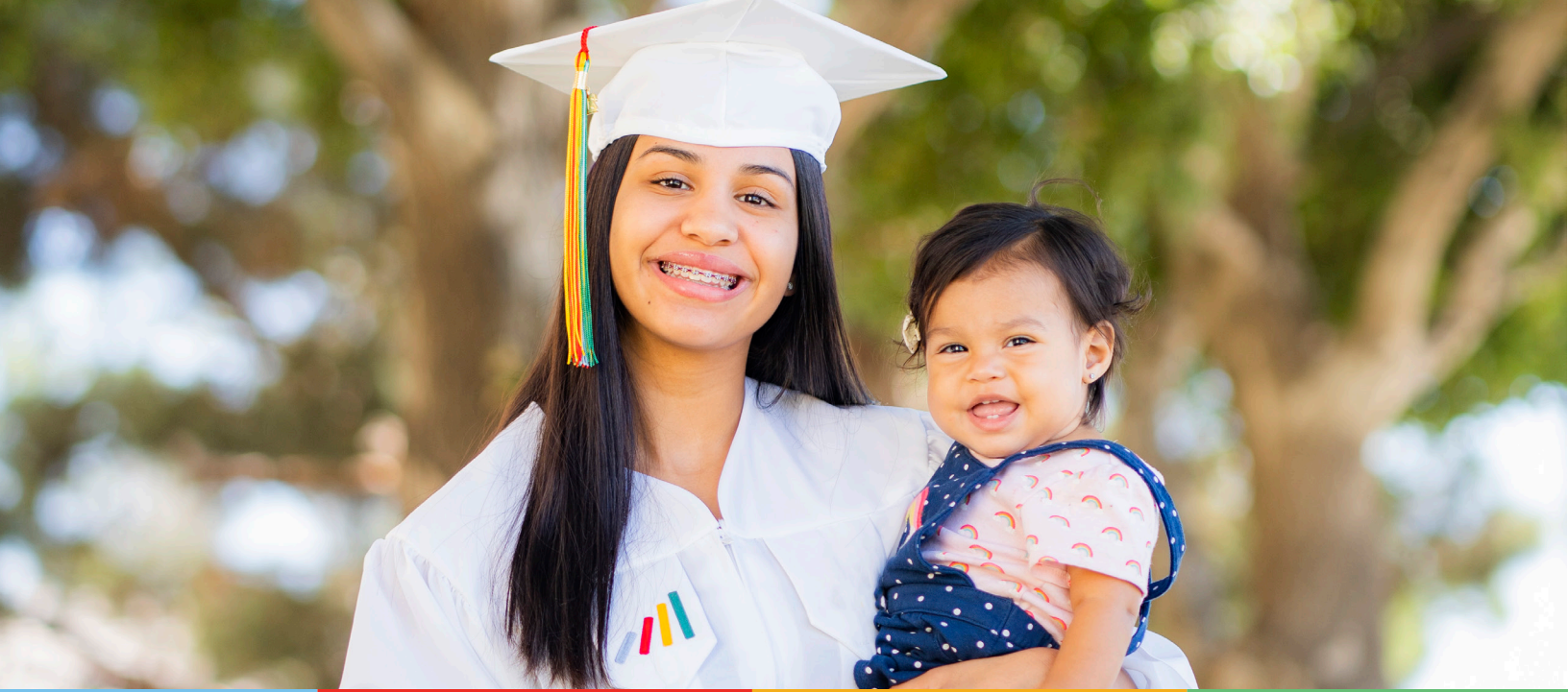
TABLA 26a: TASA DE GRADUACIÓN POR GRUPO DE ALUMNOS, TASA GRUPAL DE UN AÑO DEL DASS AÑO LECTIVO 2021-2022